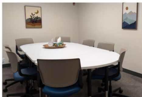
Grupo de Apoyo EN PERSONA MIÉRCOLES | 5:30-7:00PM