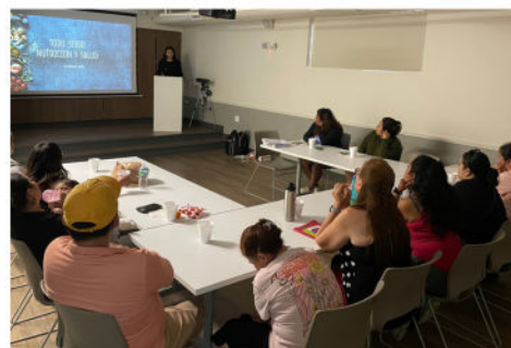
Charlas con Propósito EN PERSONA JUEVES | 6:00-7:00PM