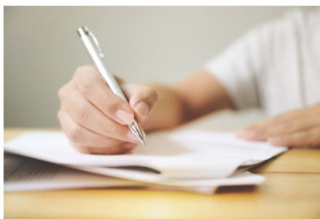
Servicios de Apoyo CON CITA

La Biblioteca de Highwood ofrece servicios gratuitos de apoyo para la salud emocional.