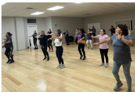
Zumba EN PERSONA LUNES | 6:00-7:00PM